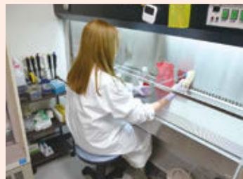
細胞培養の実験風景

学生には私の指示を待つのではなく、まずは自分で考えることを求めています。もちろん自分で考えられる学生もいますが、いろいろな学生がいるので杓子定規にいけるわけはありません。それぞれの個性を見極めながらアドバイスをしています。