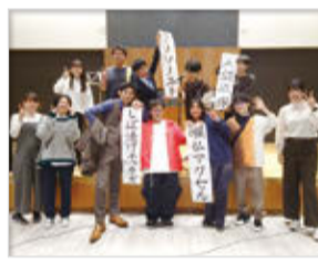
みんなお笑いが大好きです!