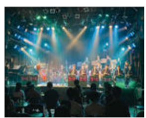
冬ライブでのビッグバンドの演奏

私たちは毎週月・水・土曜日に活動しており、少人数のコンボと大人数のビッグバンドでジャズを演奏しています。元々ジャズをしていた人は少なく、クラシックや吹奏楽から入った人や楽器未経験者がほとんどです。夏と冬にあるライブに向けて、みんなで日々楽しみながら演奏しています!