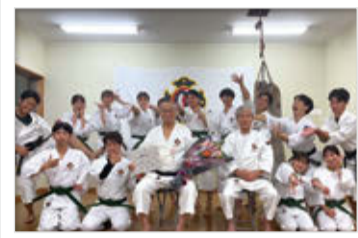
少林寺拳法全日本学生大会にて優勝&8位入賞