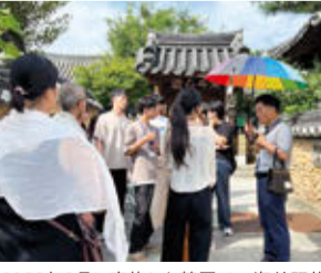
2023年8月に実施した韓国での海外研修「文化人類学実習」法文学部開講の様子