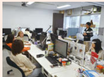
研究室はいつも和気あいあいとした雰囲気