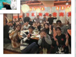
ろう者の方々と一緒に忘年会