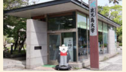
10周年企画さつもんモニュメントが完成! インフォメーションセンターに会いに来て下さい

◎編集・発行／国立大学法人 鹿児島大学広報センター 〒890-8580 鹿児島市郡元1丁目21番24号 TEL:099-285-7035 FAX:099-285-3854 E-mail:sbunsho@kuas.kagoshima-u.ac.jp