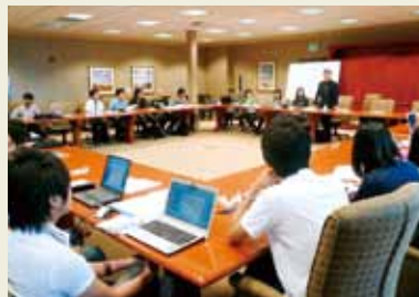
到着後のオリエンテーションの様子