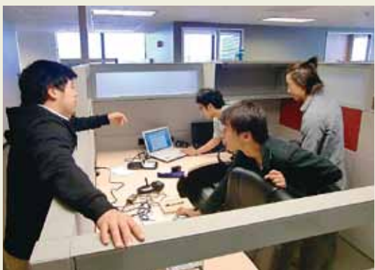
NeuroSkyでアプリケーションの問題点・改善点についてエンジニアと議論