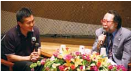
馬嶋教授(右)とのトークセッション

若田宇宙飛行士は、昨年の「ディスカバリー号」でのミッション内容やISS／「さぼろ」日本実験棟での長期滞在中の国際宇宙ステーション組み立てや実験の様子のほか、日常生活、乗組員など映像を交えながら紹介しました。また、馬嶋秀行医歯学総合研究科教授(宇宙環境医学講座)とのトークセッションも行われ、長期の宇宙滞在を可能とする研究の推進について今後の期待を語りました。最後に一般市民からの質問に対して、大気圏に突入する際の様子や宇宙での心構え等について丁寧に答え、「探究心や思いやりの気持ちを忘れずに夢や目標に向かって頑張ってください」とメッセージを送りました。