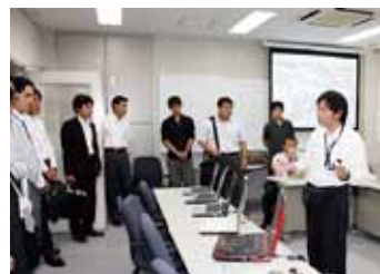
研究内容の説明を受ける参加者

産学官連携推進機構と(財)かごしま産業支援センターは、10月1日、平成22年度第1回「国立大学フェスタ2010 鹿児島大学ラボツアー」を開催しました。これは、県内企業の活性化と県内企業等と大学間の共同研究の足がかりとなることをめざす「産学官連携サポーター事業」の一環で、県内の大学等が保有する研究シーズと、県内企業のニーズをマッチングする機会を創設するものです。今回は、県内企業関係者約80名が鹿児島大学の電子情報通信関連分野の5つの研究室を訪問し、地域企業と大学との交流・情報交換を行いました。