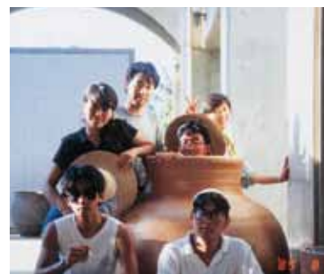
琉球大で行われた臨海実習で。このときの仲間とは実習後も大学を訪問し合ったり、就職後も付き合いが続くなど、よい関係を築くことができた