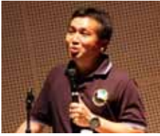
講演する若田宇宙飛行士