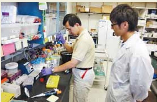
スタンフォード大学での遺伝子実験