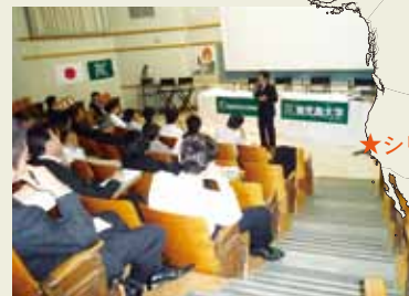
日米未来フォーラムの様子