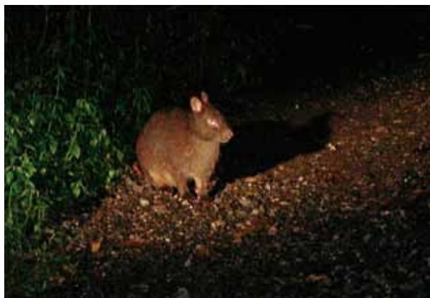
アマミノクロウサギ

屋久島は花崗岩が海底から押し上げられてできた島で、全体が岩でできています。花崗岩の上に薄い土壌が乗っただけなので、樹木の成長が遅く年輪が緻密になって長寿の木ができあがります。その代表が縄文杉です。樹齢は一説には7200歳ともいわれています。縄文杉に限らず千年を超える杉がたくさんあり、ツガやヒメシャラなどおおむね大木にな