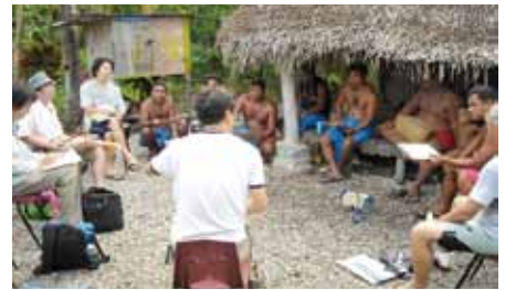
鹿児島県の島嶼域およびミクロネシア連邦で行った、環境変動の影響調査の風景