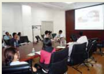
中国東北大学での学生交流会