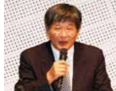
講演する土方センター長

鹿児島大学は、8月20日、「進取の精神に関する講演会と学生憲章ワークショップ」を開催しました。これは、鹿児島大学憲章に基づいて第2期中期目標に掲げられた「『進取の精神』を有する人材の育成」の全学的な共通理解を図るとともに、授業開発、系統的なカリキュラムの構築や学生の行動指針となる「鹿児島大学学生憲章」の原案策定に向け開催されたものです。