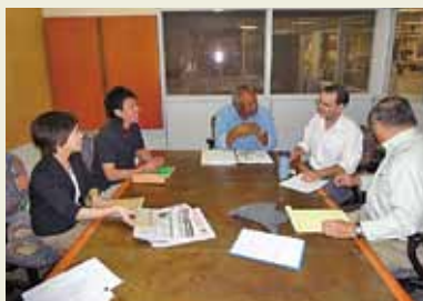
San Jose Mercury Newsで編集会議に参加