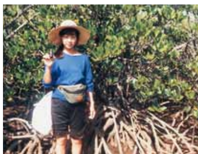
大学2年のころ、西表島のマングローブの前で

高校生のころは保健室の先生になりたいと思っていました。「養護教諭になるなら教育学部だから文系だね」という先生からのアドバイスで、疑問も持たず文系クラスへと進みましたが、だんだん生物関係の勉強をしたいと考えるようになってきました。ただ、現役では第一志望の学校に通らず、高校卒業後は親に勧められた看護学校に通っていたんです。でも、やっぱり生物の勉強がしたいと看護学校を退学し、