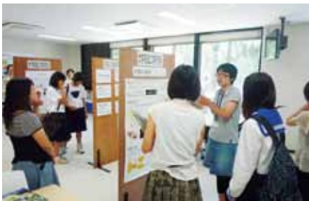
研究活動について説明する大学院生